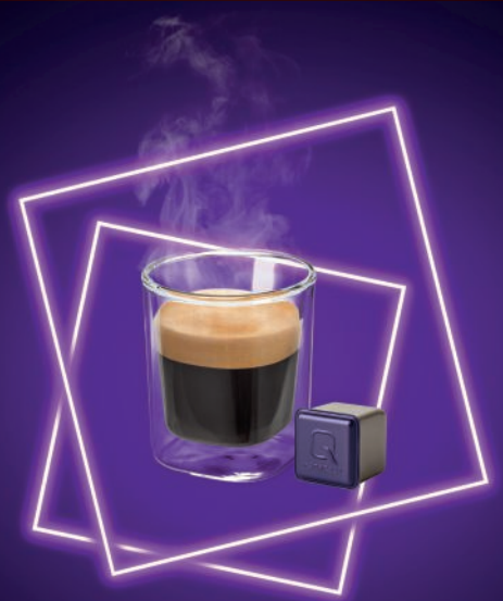
ECKIGE KAPSEL, VOLLES AROMA.