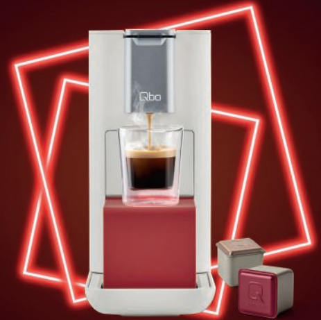
NEUES KAPSELSYSTEM, ECKIGE KAPSEL.