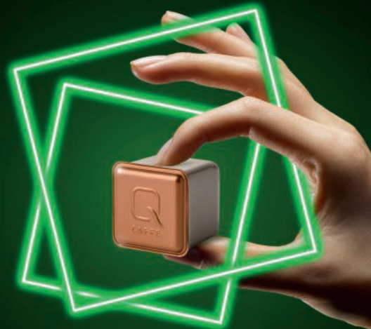
EINE ECKE NACHHALTIGER.